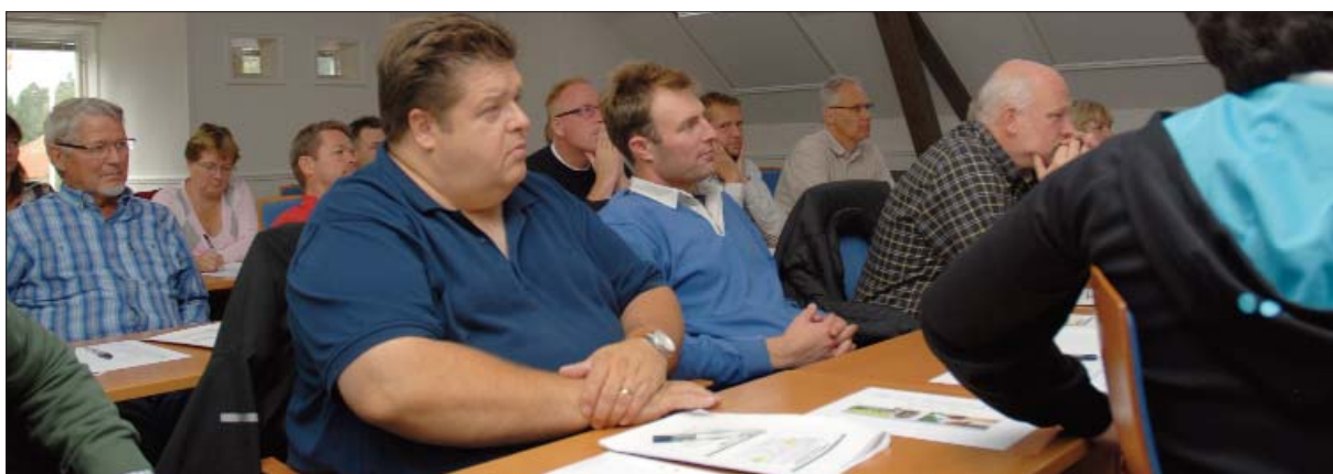
Det var engagerade STAFare som var på plats på Höstkonferens. Det kunde varit fler deltagare, men de somv ar med missade inget tillfälle att delta i debatten.

Allt blev inte till fullo besvarat, en del frågor fick följa med tillbaka till Riksskatteverket. Det om något visar att det gäller att vara uppmärksam när man gör arbete där ROT-avdraget ska finnas med.