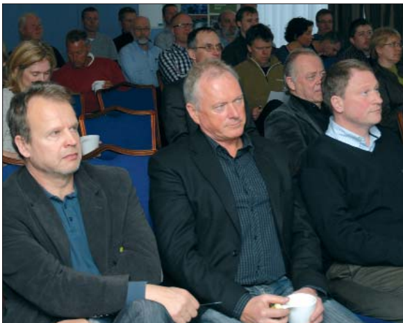
Nordiska vänner var som vanligt på plats. Här är det Finland, Norge och Danmark som bänkat sig för grannlandsårsmöte.

Det blev en härlig årsmöteskväll, med glada STAFare i snart sagt varje hörn. Servering och förtäring var - vad kan man annars vänta sig - av bästa "märke" när Hotel Strand dukade upp. I vårt lilla "galapeteri" kan man ana att glädjen stod högt i tak mest hela kvällen. I samband med supén delades det också ut utmärkelser. De nordiska gästerna passade också på att bedyra sina varma känslor för svenska trädgårdsanläggare.