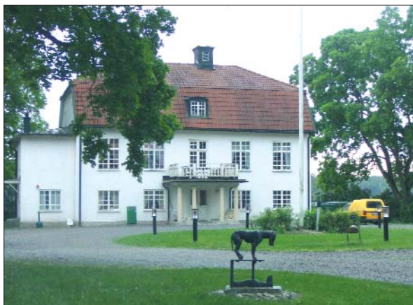
landstinget vill sälja Berga Naturbruksgymnasium, vilket lett till problem för skolan.